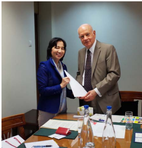
アテネでパパディミトリウ経済・開発大臣と会見、政府が誘致活動を行っている「2025大阪万博」を宣伝し、岸田外相、世耕経産相連名の支持要請書を手渡しました。(7月10日)